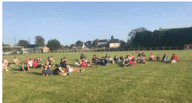
L'assemblée générale de l'entente du Trieux FC sur le terrain des sports, en septembre 2020

a repris, autant que possible, le championnat et des entraînements des équipes de l'Entente du TRIEUX sur une nouvelle surface de jeu de qualité. La réfection et l'entretien du terrain de football ont été réalisés par l'entreprise Chupin et financés par l'Agglomération sur une période de trois ans.