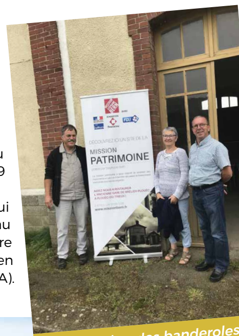
Réception des banderoles « mission du Patrimoine » en 2019

A l'heure actuelle, grâce à la publicité faite autour de notre projet de restauration plusieurs organismes se montrent intéressés : la région Bretagne, la Direction Régionale des Affaires Culturelles, le département des Côtes d'Armor, Guingamp Paimpol Agglomération, Institut National Supérieur de L'Éducation Artistique et Culturelle et le Conservatoire National des Arts et Métiers. En tout cas, le souhait communal est de créer dans la halle à marchandises un lieu de médiation culturelle (expositions, conférences, spectacles...) et dans les anciens appartements une ou plusieurs résidences d'artistes et chercheurs-professeurs.